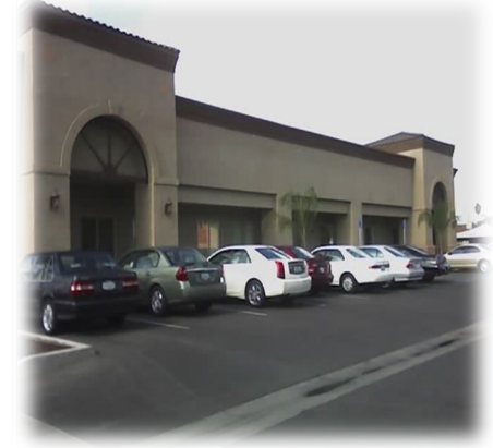
Children, Youth and Family Recovery Center 117 N. R Street, Madera, Ca