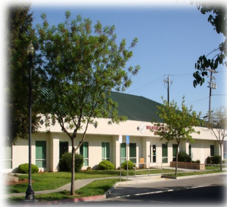
Behavioral Health Services 209 E. 7 th Street Madera, Ca

Ofrecemos servicios en 4 ubicaciones del condado.