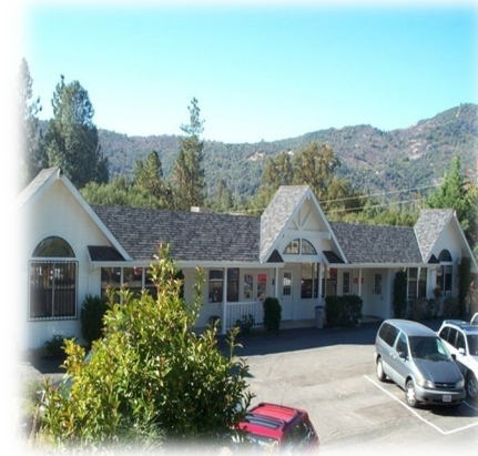
Oakhurst Counseling Center 49774 Rd 426, Suite D Oakhurst, Ca