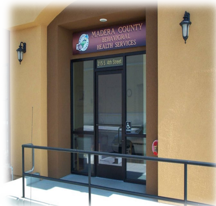
Chowchilla Recovery Center 215 S. 4th Street Chowchilla, Ca