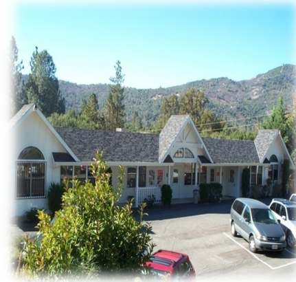
Oakhurst Counseling Center 49774 Rd 426, Suite D Oakhurst, Ca