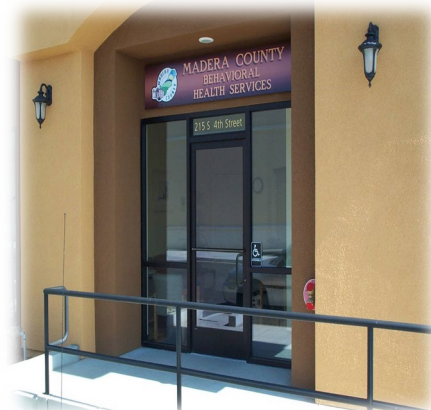
Chowchilla Recovery Center 215 S. 4th Street Chowchilla, Ca